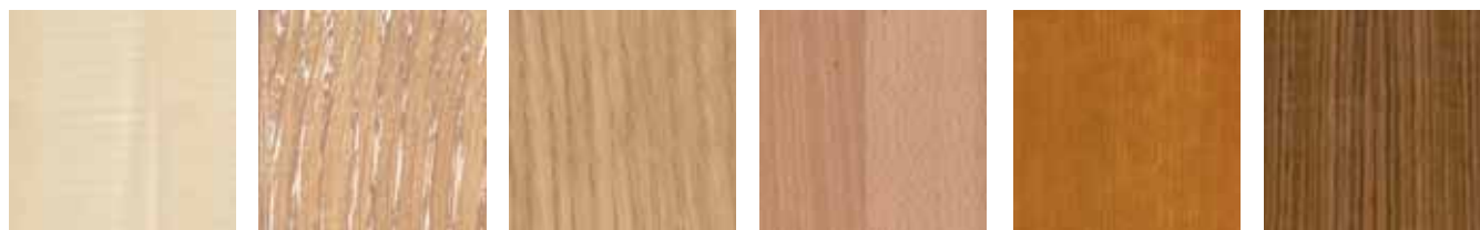
Ahorn Natur natural maple érable naturel