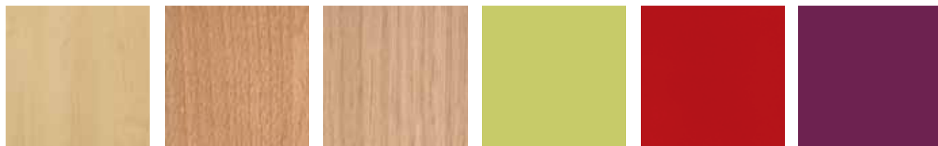
Ahorn Dekor** maple trim** imitation érable**